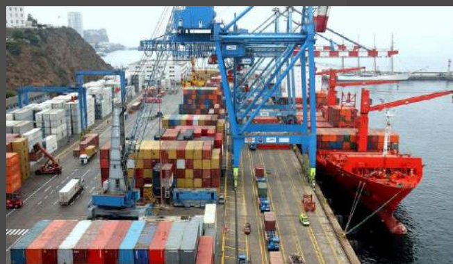
Retail - Comercio