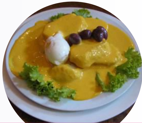
Papa a la Huancaína