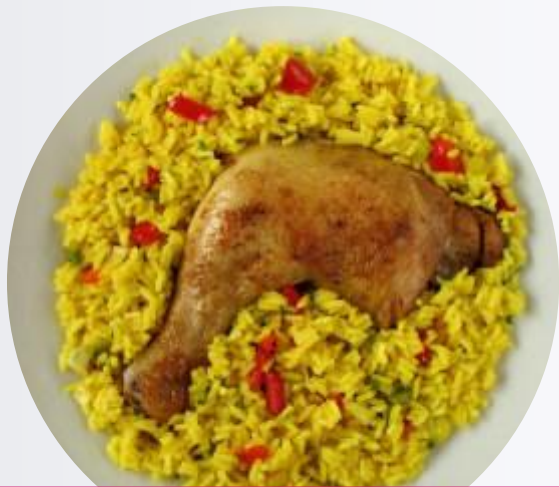
Arroz con Pollo

Entre muchos otros más de la cocina peruana e internacional